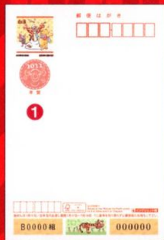
① ディズニー 年賀(インクジェット紙) 63円 *うら面は無地です。