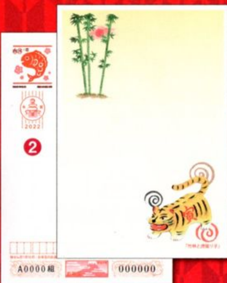
② 絵入り[寄付金付]全国版 「竹林と虎張り子」 68円 *寄付金額は1枚につき5円です。