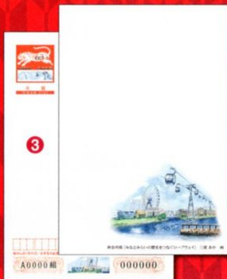
③ 絵入り[寄付金付]神奈川県版 「みなとみらいの歴史をつなぐロープウェイ」 68円 *寄付金額は1枚につき5円です。